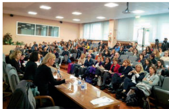
■ Alcune fra le partecipanti alla prima giornata e parte del pubblico

della vita robotica su Marte nei deserti della Terra; Francesca Borri, giornalista freelance barese di base a Baghdad; Martina Caironi, campionessa paralimpica, oro nei 100 metri e argento nel salto in lungo alle ultime Paralimpiadi di Rio; Davide Bortot e Francesca Truzzi, ideatori del progetto Cinéma du Désert, un camion che porta la magia del cinema nei luoghi più isolati del mondo; Jaha Dukureh, attivista gambiana contro la mutilazione genitale femminile, inserita dal magazine Time nella lista delle 100 persone più influenti del 2016; Ugo Mattei, giurista, docente all'Università della California e all'Università di Torino; Matt Nava, direttore creativo e cofondatore della società di videogiochi Giant Squid Studios, con sede in California; Luca Parmitano, astronauta Esa; Guido Segni, autore di "A Quiet Desert Failure", performance algoritmica sul deserto che impiegherà 50 anni per arrivare a completamento.